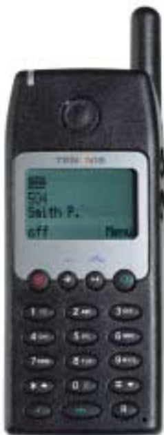
Reperibile senza fili: DECT MM 588 di Tenovis

Una reperibilità elevata viene realizzata con la funzione roaming. All'attivazione della parte mobile, il sistema si collega immediatamente e automaticamente alla cella radio più potente. Indipendentemente dal punto dell'azienda in cui vi trovate, il sistema si collega subito al telefono mobile e segnala le chiamate entranti entro un tempo minimo. Tutti i collaboratori sono quindi sempre reperibili, anche reciprocamente, tramite il rispettivo numero di chiamata interno.